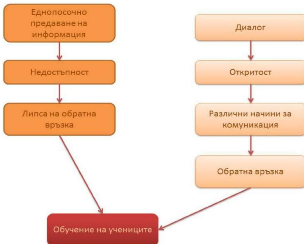
Фигура 1. Начини за комуникация и разликите между тях

Основните предимства на личните срещи се изразяват и в това, че протичат в неформална, приятелска обстановка. Някои семейства ги определят като единствения метод, при който се чувстват комфортно и могат да разискват без притеснения някои аспекти от обучението и възпитанието на своите деца в училището и въкъщи, особено когато има деликатни моменти, които засягат техния характер, външен вид или други особености.