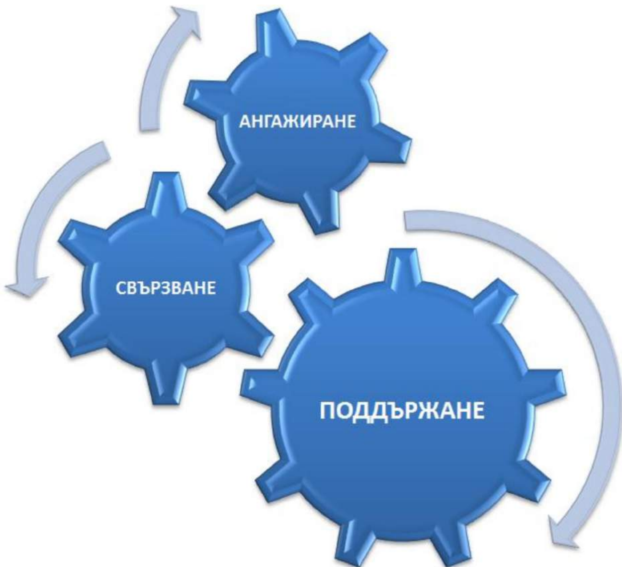
Фигура 1. Механизъм на включване и утвърждаване на родителското участие в опазване и поддържане здравето на учениците в училище

В документа е отделено специално внимание на предизвикателствата и начините за тяхното преодоляване. Дефинирани са шест основни